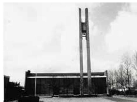
De Verrijzeniskerk in Grootstal/Hatertse Hei met klok

Hans van Gennip (eerder gepubliceerd in Ontmoeten juli-aug. 2020)