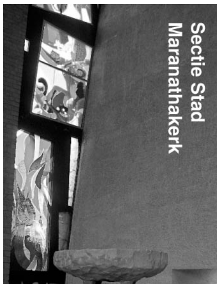
Secctie Stad Maranathakerk