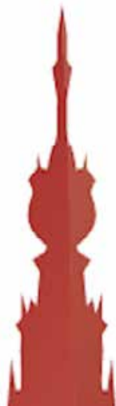
Oecumenisch Citypastoraat / Thuis in de Stevenskerk

In het centrum zijn activiteiten van het Oecumenisch Citypastoraat in de - Stevenskerk: www.stadskerknijmegen.nl postadres: Kerkboog 2, 6511 VX Nijmegen - St. Jacobskapel: Glashuis 4, 6511 CR Nijmegen, www.jacobskapel-nijmegen.nl - Titus Brandsma kapel (Doddendaal)