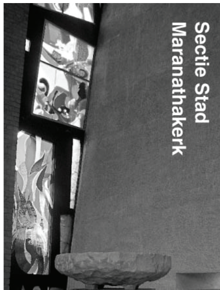
Secitie Stad Maranathakerk

Iedere zondag van 15.30-17.30 uur is de Titus Brandsma Kapel (aan de Kroonstraat) open voor mensen van de straat en kunnen zij elkaar ontmoeten van mens tot mens, niets meer en niets minder. Van 16.00-16.45 uur is er een korte viering waarin we met elkaar spreken over de (on)zin van het leven.