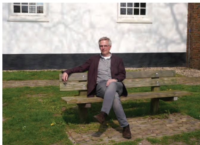
Op het bankje voor het Witte Kerkje te Bemmell, mijn vorige werkplek

Hoe ziet een PGN uit die in 2020 verder gaat met nieuwe professionals. Welke opdracht krijgen zij mee? Welke netwerken zijn er die daar op aansluiten resp. om duidelijke vormen van ondersteuning vragen?