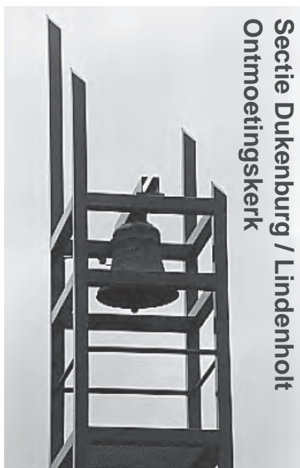
Sectie Dukenburg / Lindenholt Ontmoetingskerk