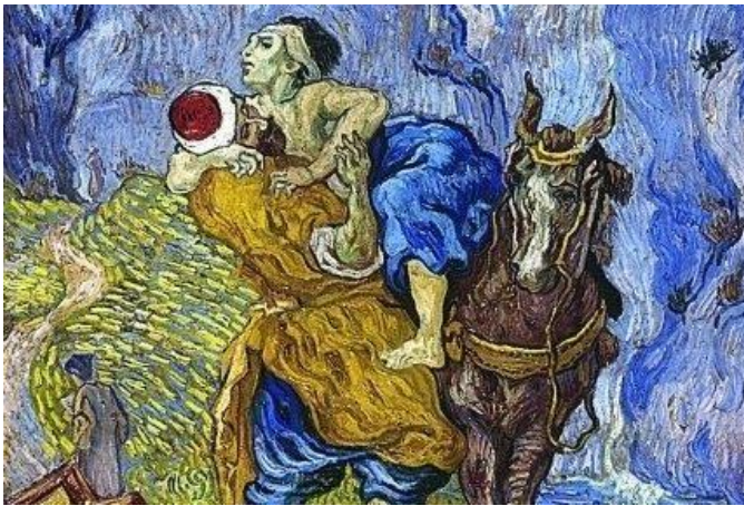
Vincent van Gogh Barmhartige

Om de onderlinge communicatie goed te laten verlopen, benutten wij alle media zowel analoog als ook digitaal, met bijzondere aandacht voor de website en sociale media.