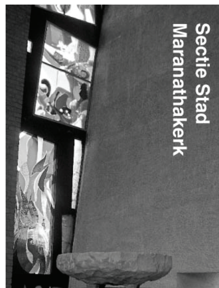
Secie Stad Maranathakerk

Van 16.00-16.45 uur is er een korte viering waarin we met elkaar spreken over de (on)zin van het leven.