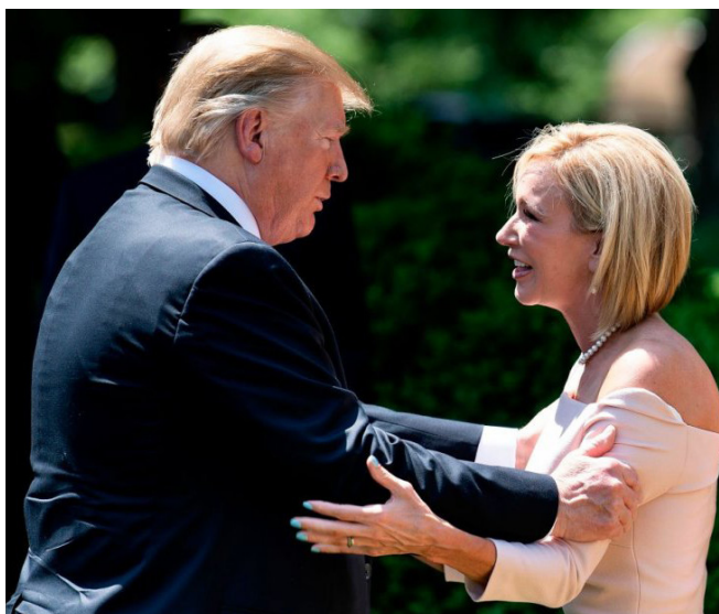
De Amerikaanse president Donald Trump spreekt met Paula White na een bijeenkomst op de Nationale dag van gebed in het Witte Huis in Washington op 2 mei 2019

Ik ben nog niet zover dat ik vind dat christenen zich niet politiek moeten organiseren.