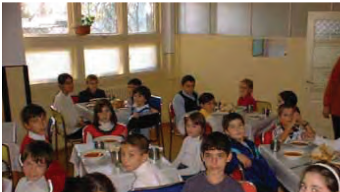
Kinderen van Caminul Phillip aan de maaltijd