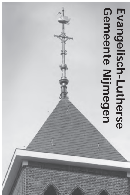
Evangelisch-Lutherse Gemeente Nijmegen