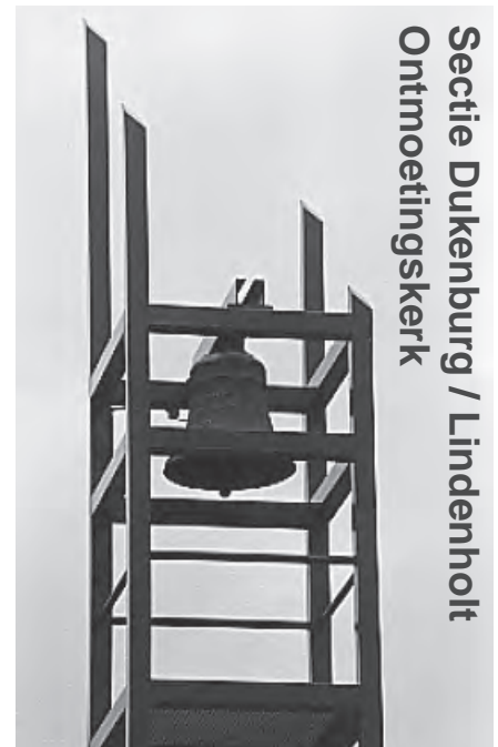
Sectie Dukenburg / Lindenholt Ontmoetingskerk