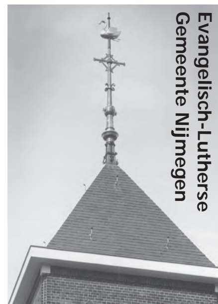
Evangelisch-Lutherse Gemeente Nijmegen

Iedere zondag van 15.30-17.30 uur is de Titus Brandsma Kapel (aan de Kroonstraat) open voor mensen van de straat en kunnen zij elkaar ontmoeten van mens tot mens, niets meer en niets minder. Van 16.00-16.45 uur is er een korte viering waarin we met elkaar spreken over de (on)zin van het leven.