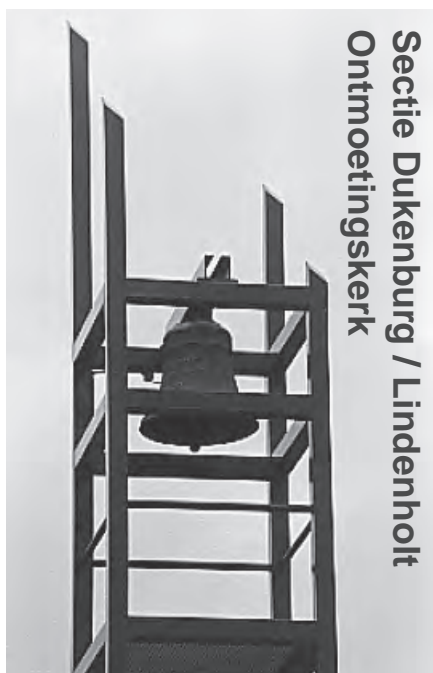
Sectie Dukenburg / Lindenholt Ontmoetingskerk