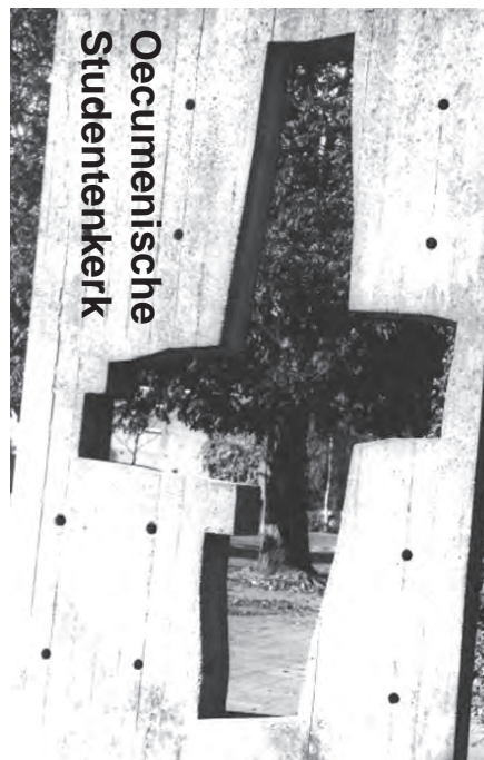
Oecumenische Studentenkerk Erasmuslaan 9a, 6525 GE, tel. 3619188 e-mail: secretariaat@studentenkerk.ru.nl website: www.ru.nl/studentenkerk facebook: facebook.com/studentenkerk

Uw kans om – samen met de auteur – van gedachten te wisselen over dit bijzondere boek.