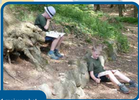
In het weekend van 30 en 31 mei was het kamp van de Kindernevendienst in Mook, met als thema 'Vogels'.