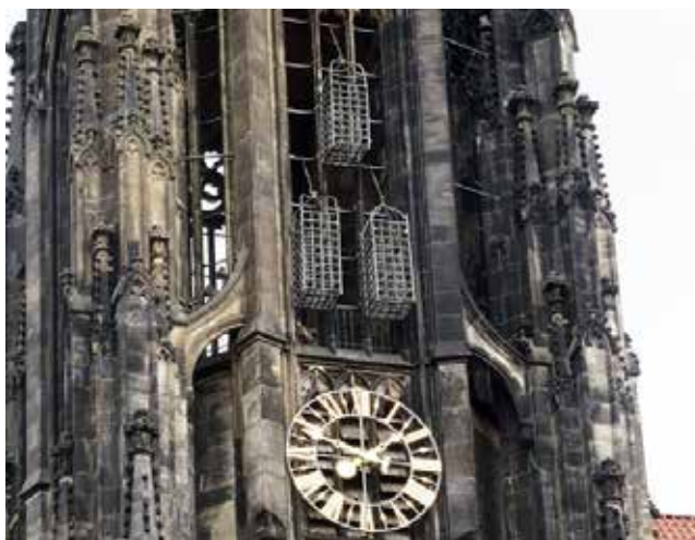
Toren van de Lambertuskirche in Münster