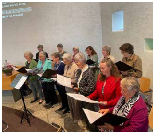
Cantorij van Ontmoetingskerk in Maranathakerk (17-5-2026)