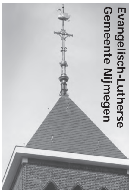
Evangelisch-Lutherse Gemeente Nijmegen