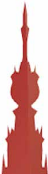
Oecumenisch Citypastoraat / Thuis in de Stevenskerk

Coördinator: vacant. Voorlopig kunt u voor pastorale vragen direct contact opnemen met de pastores (zie Contactadressen op p. 10).