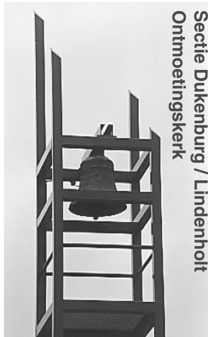
Secitie Dukenburg / Lindenholt Ontmoetingskerk

Meijhorst 70-33, 6537 EP, tel. 344 39 56