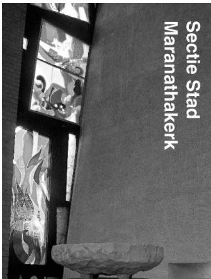
Secitie Stad Maranathakerk