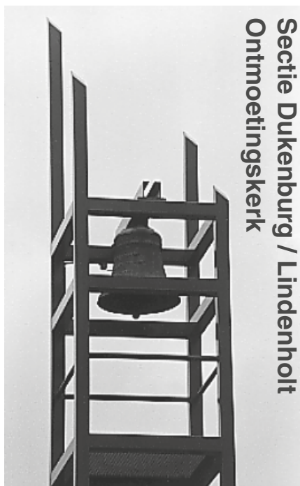
Secitie Dukenburg / Lindenholt Ontmoetingskerk

per e-mail: hendrik.jan.bosman@gmail.com