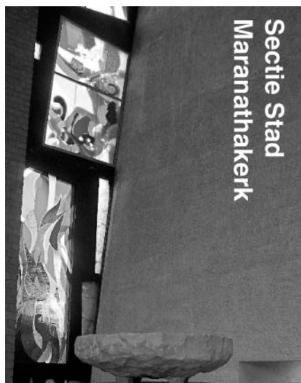
Secitie Stad Maranathakerk