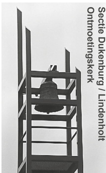
Secitie Dukenburg / Lindenholt Ontmoetingskerk

per e-mail: hendrik.jan.bosman@gmail.com